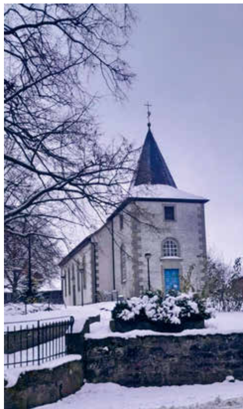
St. Martini-Kirche in Hilligsfeld im Schnee