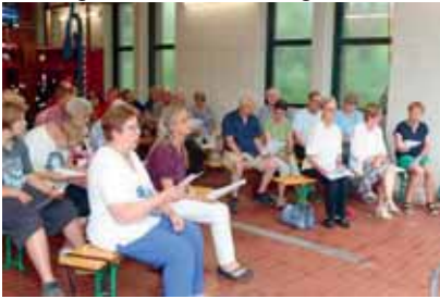
Sommerkirche 2025 in Unsen

Seit fast zwanzig Jahren veranstaltet die Kirchengemeinde „An der Hamel“ in den Sommerferien die so genannte „Sommerkirche“, seit etwa acht Jahren in enger Zusammenarbeit mit der Kirchengemeinde "St. Aegidien".